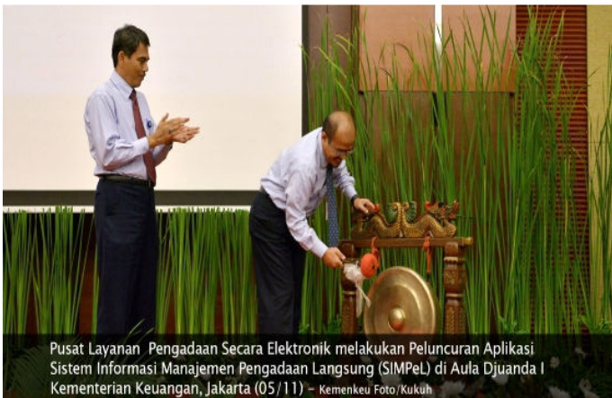
Pusat Layanan Pengadaan Secara Elektronik melakukan Peluncuran Aplikasi Sistem Informasi Manajemen Pengadaan Langsung (SIMPeL) di Aula Djuanda I Kementerian Keuangan, Jakarta (05/11) – Kemenkeu Foto/Kukuh

Jakarta, 05/11/2014 MoF (Fiscal) News – Hari ini, Kementerian Keuangan melalui Pusat Layanan Pengadaan Secara Elektronik (LPSE) melakukan Peluncuran Aplikasi Sistem Informasi Manajemen Pengadaan Langsung (SIMPeL) di Aula Djuanda I Kementerian Keuangan, Jakarta (05/11).